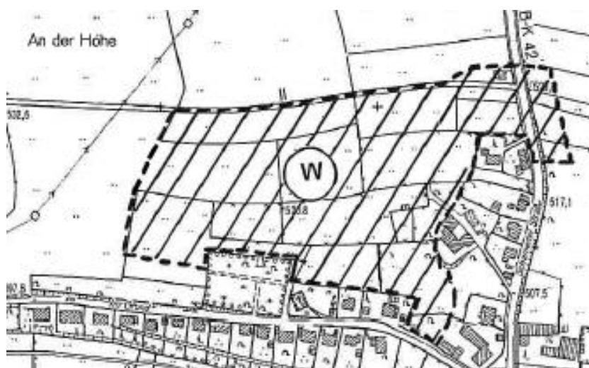
21. Änderung Flächennutzungsplan Erndtebrück

Mit der 21. Änderung dieses Flächennutzungsplanes wurde im Jahr 2005 im Ortsteil Schameder eine Wohnbaufläche in Größe von ca. 5 ha ausgewiesen. Bei der Aufstellung des Dorfentwicklungsplanes für Schameder war man zu dem Ergebnis gekommen, ein Neubaugebiet am nordwestlichen Dorfrand zu entwickeln. Ein Jahr zuvor war der Bebauungsplan Nr. 04 in Schameder "Industriepark Wittgenstein" rechtskräftig geworden, und man rechnete im Zuge der Entwicklung der Gewerbe- und Industrieflächen auch mit einer regen Nachfrage nach Wohngrundstücken in diesem Ortsteil.